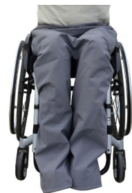
Teilung unterm Knie