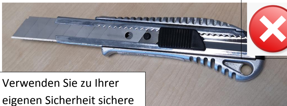
Verwenden Sie zu Ihrer eigenen Sicherheit sichere Werkzeuge