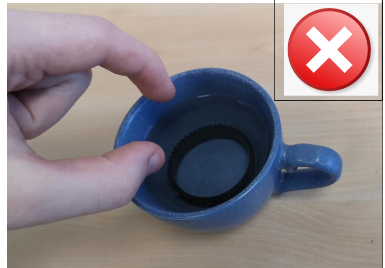
Verwenden Sie keine Finger, um die Bremsauskleidung zu entfernen