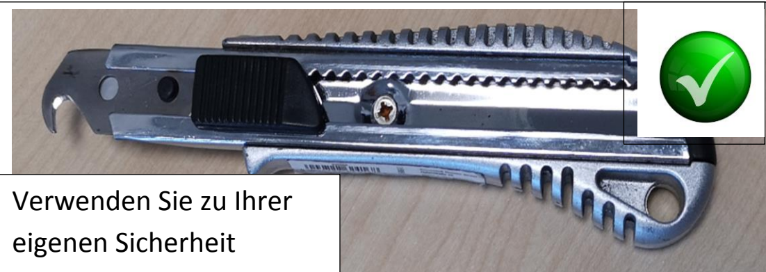
Verwenden Sie zu Ihrer eigenen Sicherheit sichere Werkzeuge