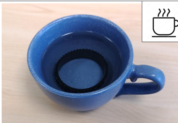
Legen Sie den Ersatzbremsbelag 10 Minuten lang in heißes Wasser (80 ° C)