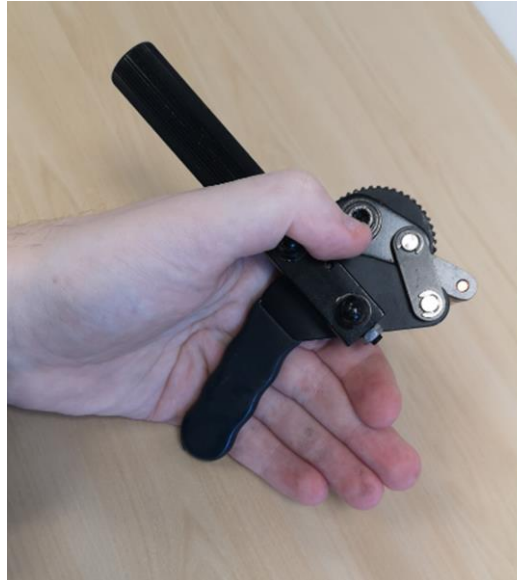
Um sicher zu schneiden, halten Sie bitte die Bremse wie auf dem Bild