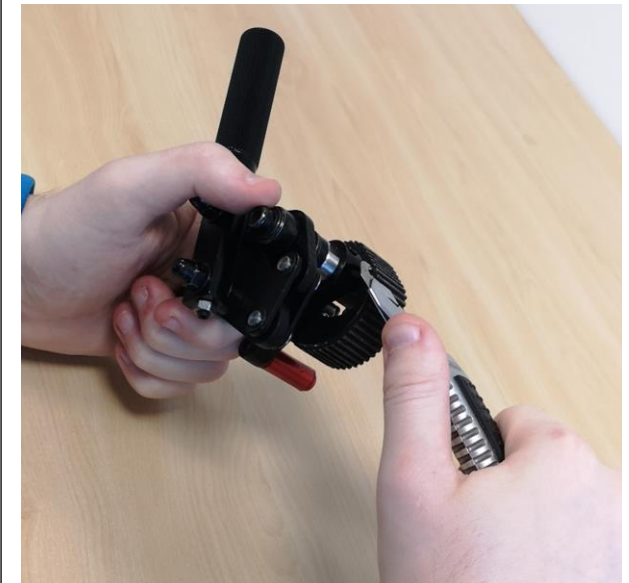
Bitte schneiden Sie beim Schneiden von Ihnen weg